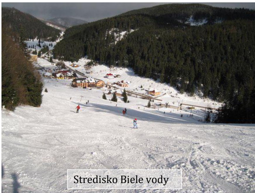
Stredisko Biele vody

Prajeme Vám príjemný pobyt v lone prírody.