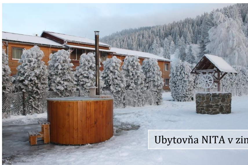
Ubytovňa NITA v zime a v lete

Ubytovňa poskytuje jedáleň s bufetom, stolný tenis, stolný futbal, biliard, fínsku a infra saunu.